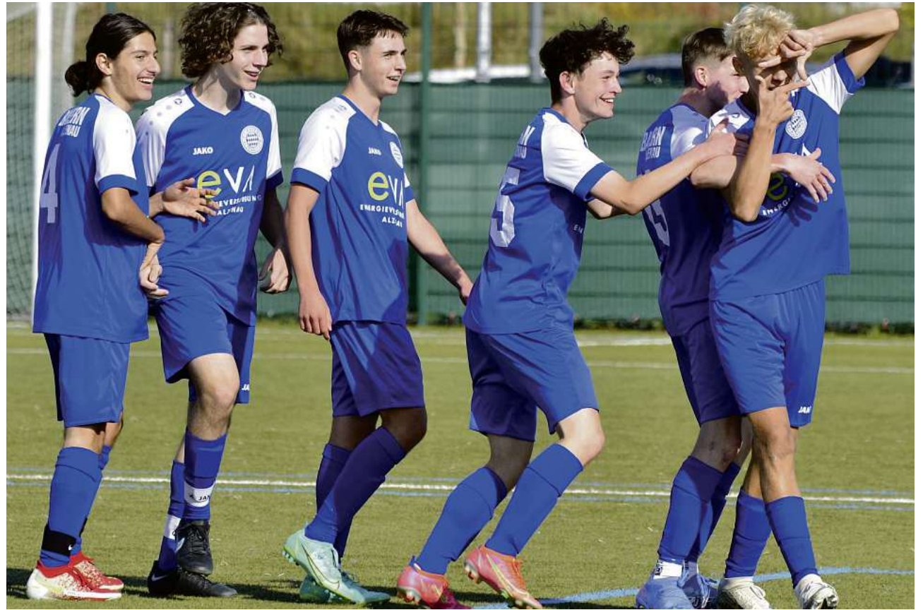
Die Sommerferien neigen sich dem Ende entgegen und so langsam starten die Saisons in den Jugendspielklassen. Auch in der Saison 2022/2023 hoffen wir auf möglichst viele Jubelszenen unserer Nachwuchsfußballer.